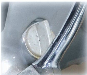
POZIOM OLEJU SILNIKA