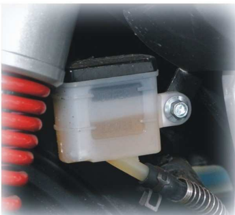
POZIOM PŁYNU HAMULCOWEGO HAMULCA TYLNEGO